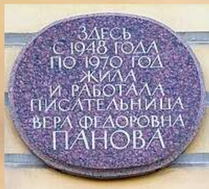
Мемориальная доска в Санкт-Петербурге, Марсово поле, д. 7 («Дом Адамини»)

Писательница умерла в начале весны 1973 года. Покоится под Санкт-Петербургом, в местечке Комарово.