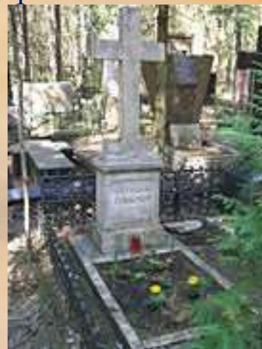
Памятник на могиле является культурно-историческим наследием федерального уровня охраны