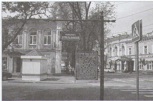
Тургеневский переулок – бывший Депальдовский.

Переулок расположен между улицами Греческой и Чехова. Протяженность – 890 метров. На пересечении Варвацевского переулка и Иерусалимской улицы стоял греческий мужской монастырь, здание которого было уничтожено в 1920-е годы. На жилом доме, построенном на этом месте, в 2005 году установлена мемориальная доска. Сохранился монастырский дом, в настоящее время здесь жилые квартиры. Еще одной