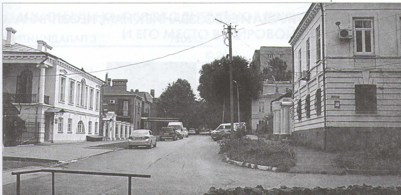
Улица Шмидта, бывшая Мало-Греческая.

П.Ф. Иорданов сделал для Таганрога столько, что впору называть его именем большие улицы и ставить ему памятник.