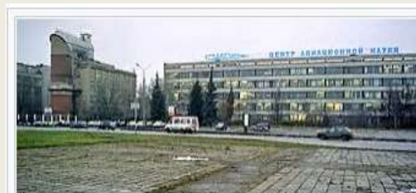
ЦАГИ в Жуковском, слева — «штопорная» аэродинамическая труба Т-105

ВТИ, первый образованный в стране в 1921 г. научно-исследовательский институт отраслевого профиля, неизменно является национальным центром фундаментальных и прикладных знаний в области теплоэнергетики и теплотехники, обладает современной экспериментальной базой и широкими научными связями с российскими и зарубежными энергокомпаниями и научными организациями.