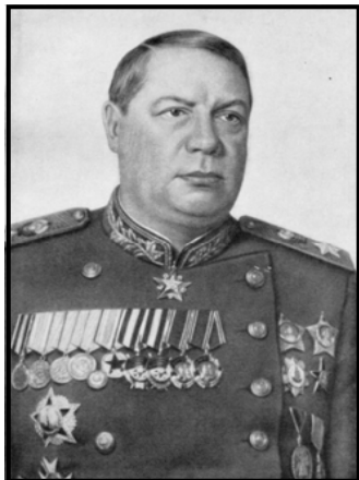
Толбухин Федор Иванович (1894-1949)

Родился в деревне Андроники Ярославской области в крестьянской семье. Перед Первой мировой войной жил в Петербурге, работал бухгалтером. Был призван в армию рядовым. За проявленную в боях храбрость получил офицерский чин и был награжден орденами Св. Анны и Св. Станислава.