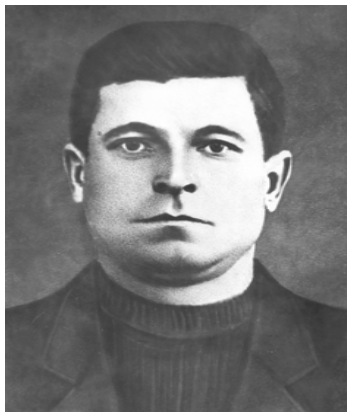
Плотников Максим Фёдорович (1906– 1943)

Родился и вырос Максим Федорович в семье рыбака в Морском Чулке. В годы первых пятилеток молодым пареньком перешагнул проходную металлургического завода. Здесь от рабочего вырос до мастера.