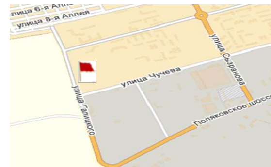
Улица Галицкого на карте города