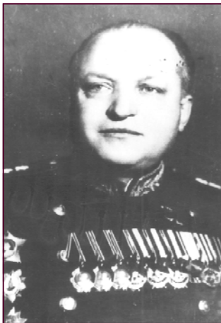
Галицкий Кузьма Никитович (1897-1973)

Родился 24 октября 1897 года в городе Таганроге в рабочей семье. Окончил начальную школу и с 1912 года работал в железнодорожном депо станции «Таганрог». Сначала он работал помощником слесаря по ремонту паровозов. Смышлёного парня заметили и послали учиться на машиниста. Он стал помощником машиниста и начал водить гружёные составы на перегоне Таганрог-Ростов.