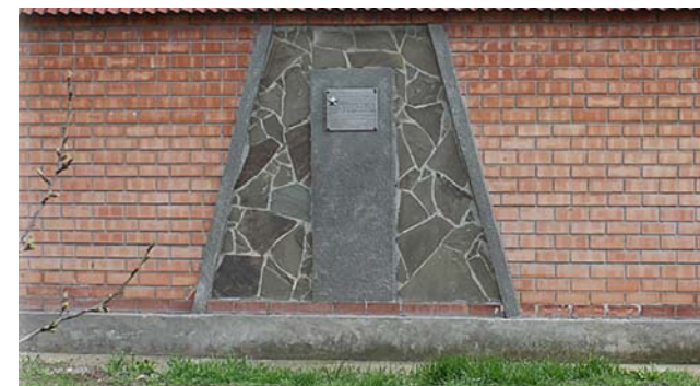
Мемориальная доска на месте, где находился дом Афоновых пер. Перекопский, 30

В послевоенные годы домик по Перекопскому пер. был снесен. Напротив был устроен небольшой скверик с памятным знаком в центре и с лавочками. В советские времена пионеры приносили сюда цветы, ветераны приходили вспомнить минувшее. Постепенно это место пришло в запустение, памятник был разрушен. В настоящее время здесь стоит новый дом. На заборе усадьбы установлена мемориальная доска.