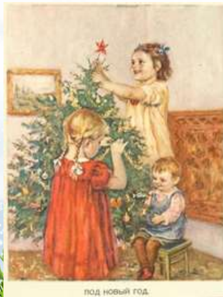
под новый год.

В Советской России на смену Рождеству пришел Новый год.