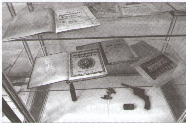
Книги о Первой мировой войне из отдела дореволюционных и ценных изданий ЦГПБ имени А.П. Чехова города Таганрога.