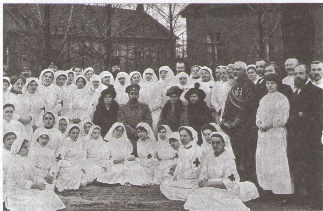
Двинск. Их Величества в саду Земского госпиталя. 2 ноября 1914 г.

Брошюра «В плену у немцев» 1915 года издания представляет факты, взятые из трудов Чрезвычайной следственной комиссии, образованной по Высочайшему повелению от 9 апреля 1915 года в целях расследования нарушений законов и обычаев войны австро-венгерскими и германскими войсками со свидетельствами и фотографиями. Книга наполнена страшными описаниями жестоких издевательств над ранеными, использования отравленных газов и разрывных пуль на полях сражения. Часть из них представляют рассказы бежавших из плена офицеров и нижних чинов.