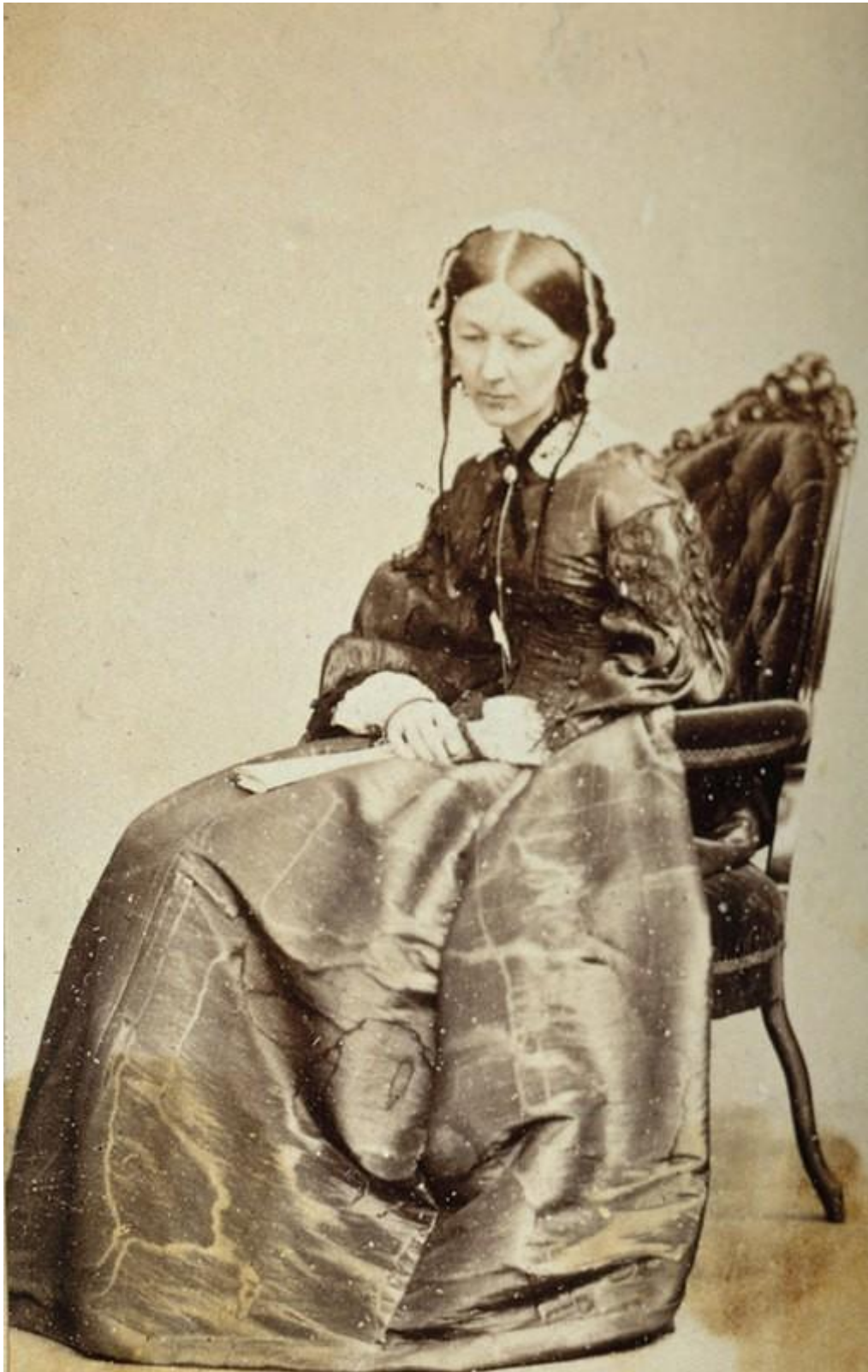
Флоренс Найтингейл. Около 1854 года

В том же 1854 году англичанка Флоренс Найтингейл, имевшая сестринское образование и управлявшая небольшой больницей в Лондоне, отправилась с 38 единомышленницами сначала