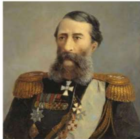
граф М. Т. Лорис-Меликов

Александр II сообщил Лорис-Меликову, что через четыре дня проект будет вынесен на обсуждение Совета министров — и в тот же день погиб от рук народовольцев, ратующих за демократические преобразования в России. В силу проект так и не вступил.