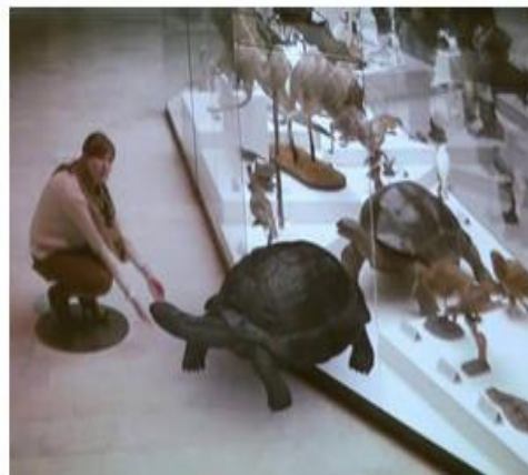
«Путешествие с животными» Дарвиновский музей