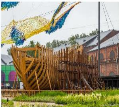
Петр I у «Фрегата» на Новой Голландии (СПб)