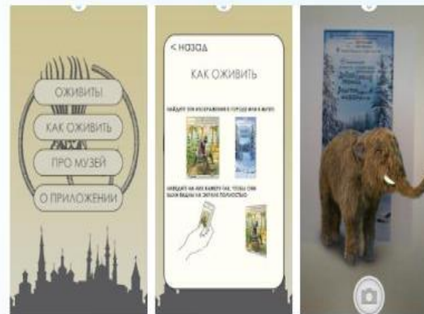
Палео AR-тур Музее естественной истории Татарстана